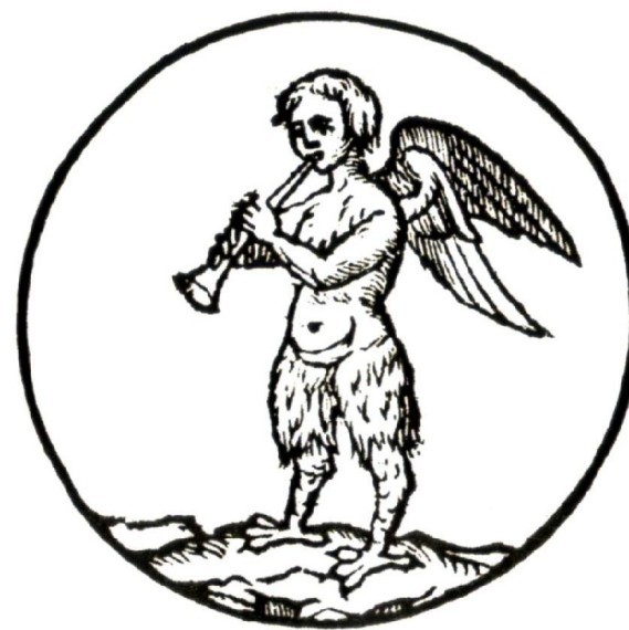
La Sirena su un'antica moneta da G. C. Capaccio

Verga di lauro Verga fiorita Verga laurita Verbo dei dormienti Albero delle partorienti Ramo di oro Gloria dell'alloro Trono dei satrapi Parola d'oro delle api Voce della Sibilla Corona regale Scettro imperiale Lingua gloriosa Lingua miracolosa Specchio imperituro Vaso della sapienza Vaso d'ogni scienza Promessa Solare Stella del Salvatore Vergine dei Vergini Gloria di Partenope Dolcezza d'ogni pena Tomba della Sirena Piede della nascita Raggio della grotta Montagna della Vergine Giardino della vita Salute degli infermi Fonte della speranza Luce dei ciechi Porta di Napoli Allontanatore dei demoni Vincitore del serpente Signore del Cavallo Testa del prezioso metallo Scudo splendente Libro ardente Principe del fuoco Arciere del comando Tromba del vento Pietra del mare Uovo del Principio Castello della salvezza Ampolla della sicurezza Torre della purezza Pozzo candido Radice perenne Scarpa del viaggio Guida del passaggio Fine ed inizio del novello raggio