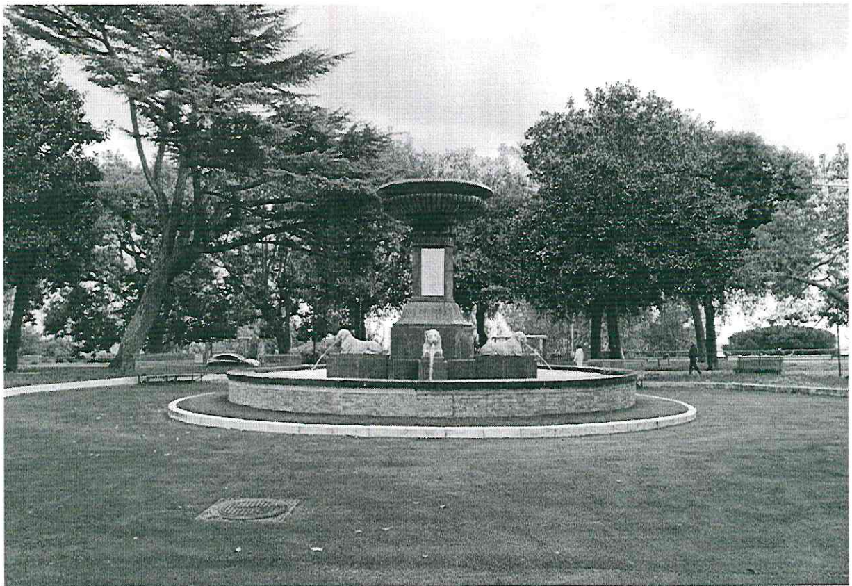
Foto n°2 - La fontana di Piazza del Porto o Fontana degli Incanti