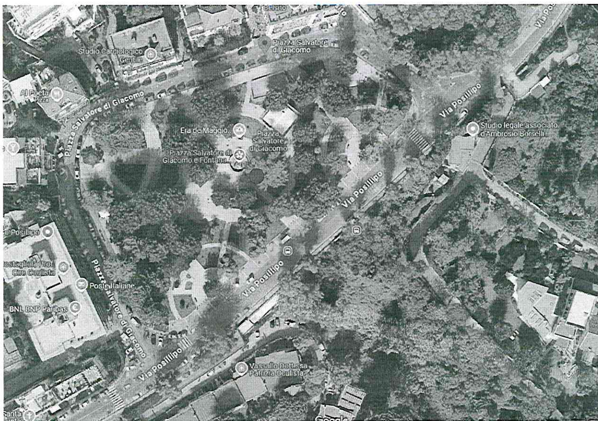
Fig.n. 1 – Vista aerea da google map dell'area e del posizionamento del leggìo informativo-turistico

Il leggìo informativo – turistico è realizzato in acciaio corten e ha un'altezza complessiva di 120 cm, una larghezza di 30 cm. La parte superiore è inclinata a forma di leggìo e su di esso viene collocata una targa in alluminio con la descrizione della fontana, il qr code, il logo del Comune di Napoli e dei Rotary Club Napoli ovest e Castel Sant'Elmo ( cfr.fig. n. 2 ) ed è riportato nell'elaborato n. 1.