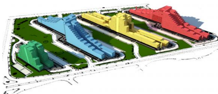
Figura 2: Modello 3D del lotto M - in verde la Vela "A"

L'intervento in oggetto riguarda le operazioni di demolizione completa fino all'estradosso della pavimentazione controterra della Vela A (verde), Vela C (gialla) e Vela D (rossa) e le attività di riqualificazione della Vela B (azzurra), compresa la sistemazione dei relativi spazi aperti risultanti dalle demolizioni.