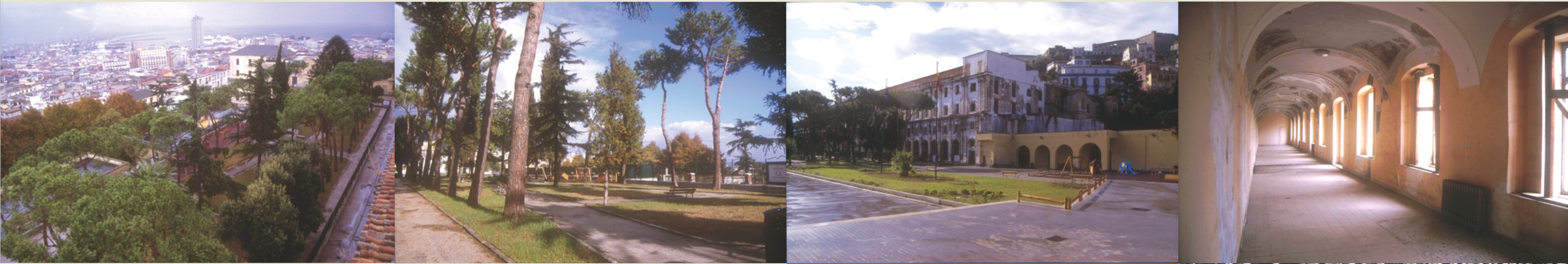
Panoramica da Ss. Trinità delle Monache, immagini del giardino aperto al pubblico, un interno