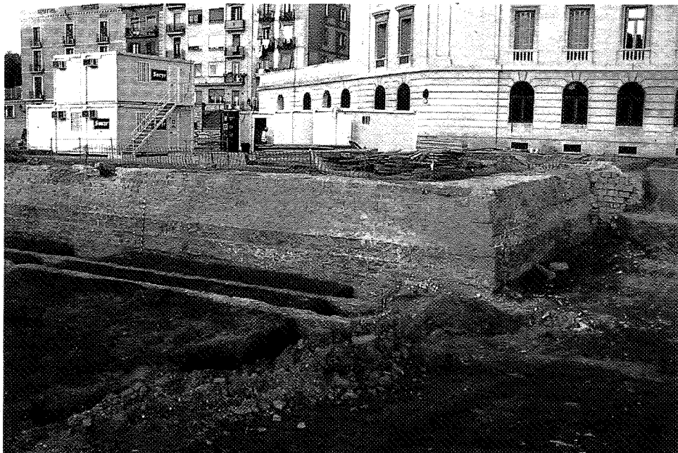
Les restes destapades del Baluard del Migdia i del Rec Comtal.

La proposta d'ahir va ser aprovada amb els vots favorables del govern (PSC i ICV) i d'ERC, grup que primer va proposar conservar aquestes restes. CiU i el PP es van abstenir.