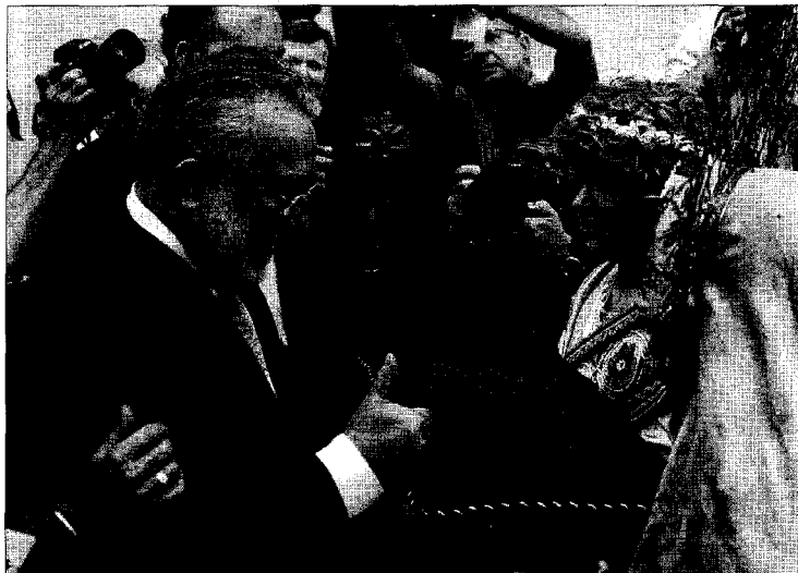
El Ministro de Sanidad, Bernat Soria, desea suerte a dos de los niños del Misteri d'Elx, antes del ensayo.

La ciudad italiana prevé acoger el Misteri en 2013 e invita a Soler al Milagro de San Genaro el próximo noviembre