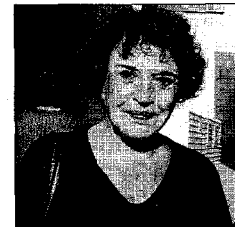
MARÍA FERNANDA D'OCÓN ACTRIZ Semejante belleza es algo digno de ser reverenciado por toda España