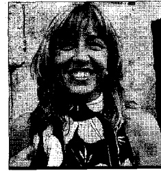
TRINIDAD MIRÓ CONSELLERA DE CULTURA Es un esfuerzo extraordinario de todo un año de trabajo para que podamos disfrutar