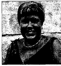
MILAGROSA MARTÍNEZ PRESIDENTA DE LAS CORTES VALENCIANAS Tenemos un ejemplo de tradición y cultura de la que todos nos sentimos orgullosos