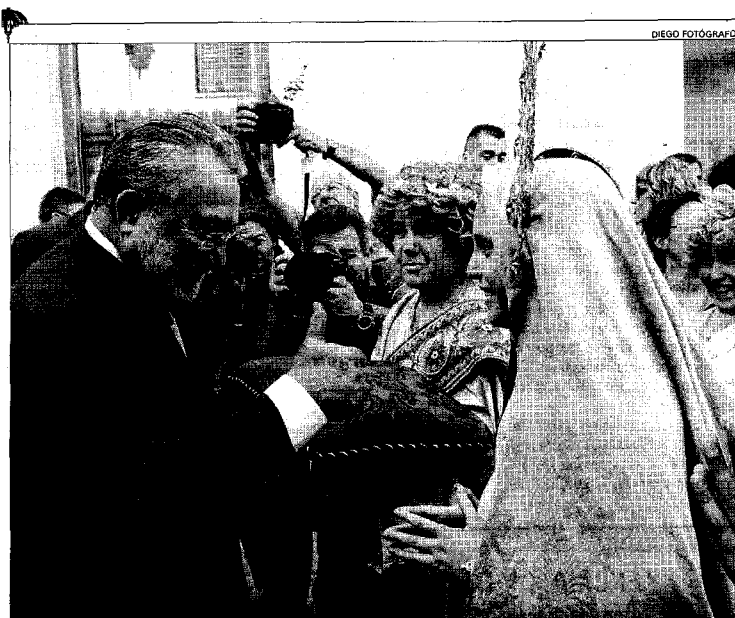
El ministro Bernat Soria, en el momento en que desea buena suerte a la María Mayor, antes de iniciar el cortejo su marcha