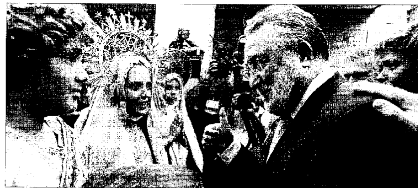
OTRABACCI / CONTRASTO

A partir de las 18 horas de hoy, tendrá lugar la primera parte del Misteri, conocido como La Vespra (muerte de la Virgen). Al acabar la representación la patrona estará en el Cadafal —la tarima