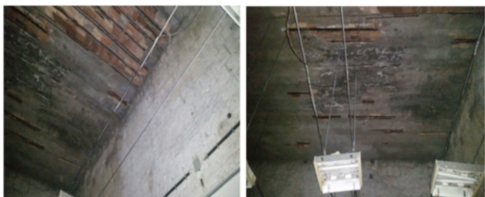
INTERVENTO N°05 INTERVENTO SULLA PARTE ALTA DELLA MURATURA ESTERNA IN TUFO DELLA SALA DEI BARONI LATO CORTILE