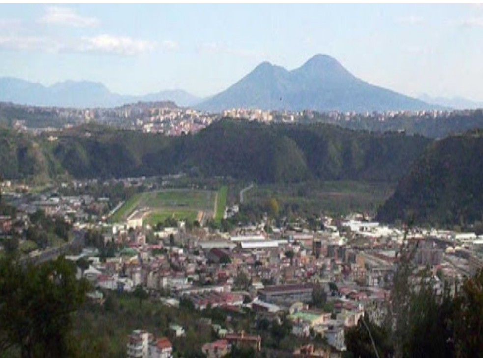
La Conca di Agnano

Al termine del suo intervento, l'ingegnere olandese, ha sottolineato che le iniziative per la valorizzazione del turismo dovranno essere accompagnate dalla creazione di posti di lavoro, presupposto essenziale e obiettivo fondamentale per consentire la sostenibilità nel tempo di qualsiasi progetto.