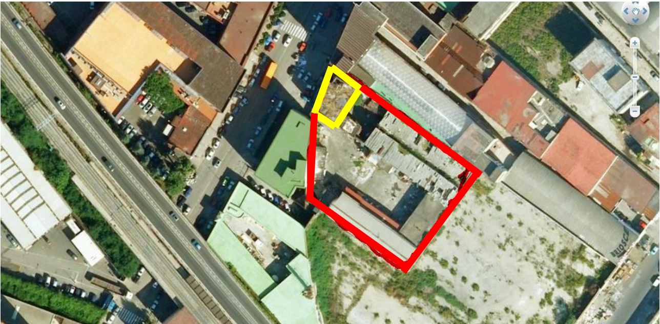
Volumi esistenti: in giallo palazzina residenziale, in rosso superfici industriali

Volume totale massimo assentibile per l'intervento = 13'774,10 mc