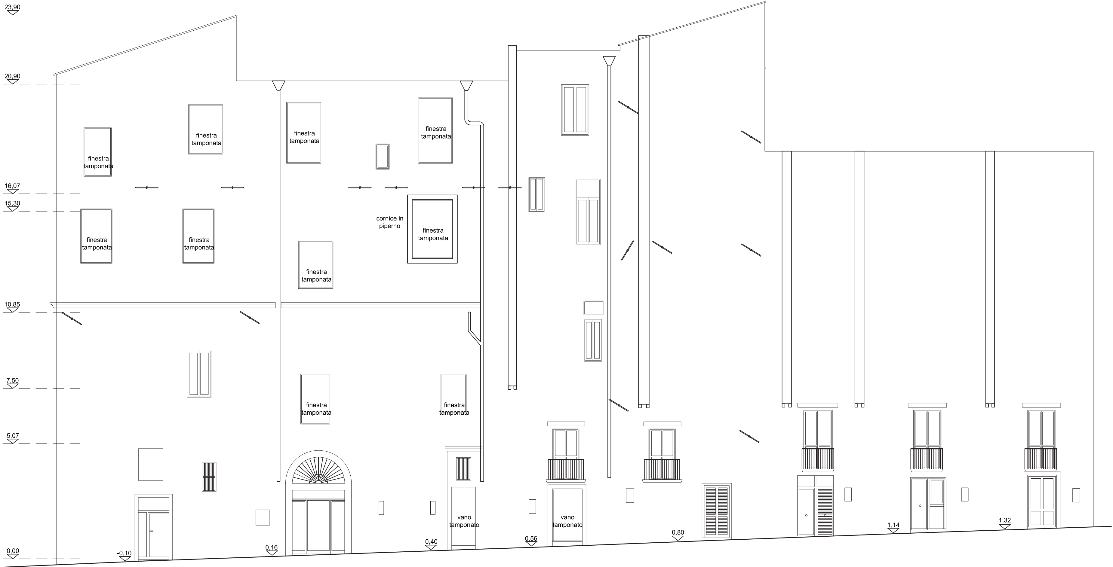
Prospetto su vico Giganti