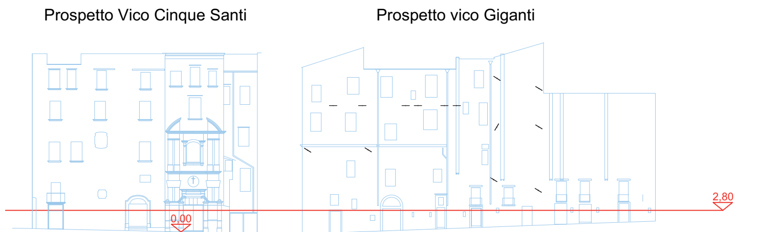
NAVIGATORE (Scala 1:500)