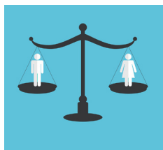
Tavola rotonda con i sindaci dell'UE: garantire l'uguaglianza di genere nelle nostre città

In vista della Giornata internazionale della donna, il 7 marzo la Commissaria per la politica regionale Corina Crețu ospita una tavola rotonda sull'uguaglianza di genere nelle città. Le donne rappresentano solo il 15% di tutti i sindaci dell'UE oggi. Consentire alle donne di ricoprire cariche pubbliche può mettere in discussione le dinamiche di potere strutturale che perpetuano la disuguaglianza di genere e può anche migliorare la vita quotidiana dei cittadini. La tavola rotonda si concentrerà quindi sui modi per garantire l'uguaglianza di genere a livello locale.