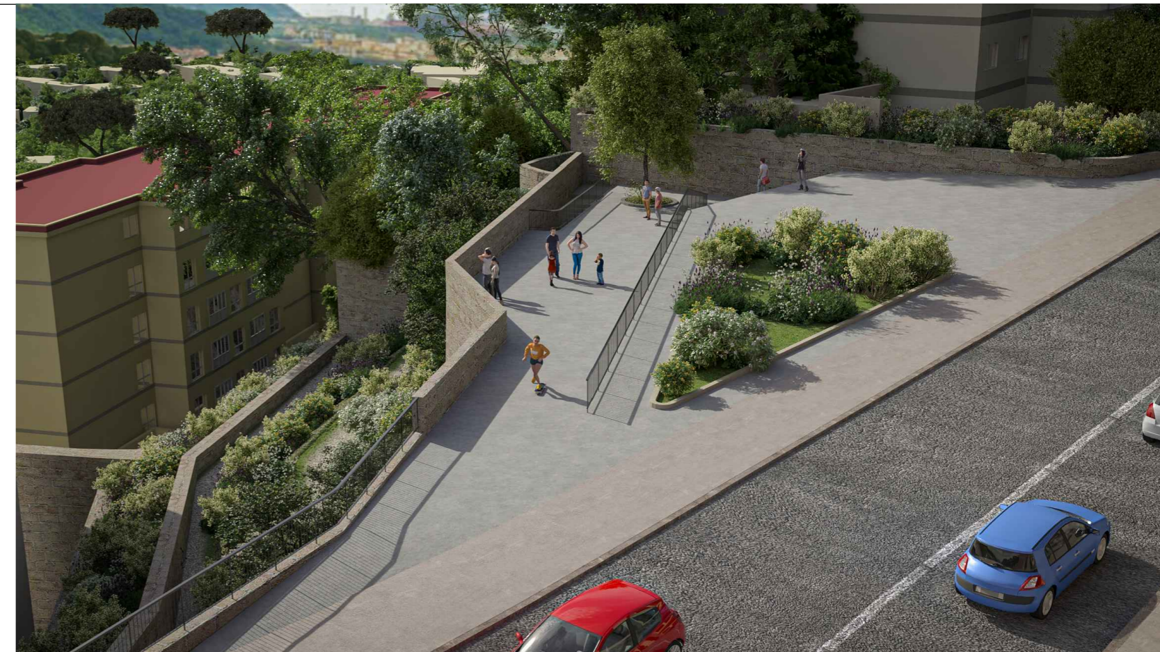
2. PIAZZA DI QUARTIERE E PROMENADE