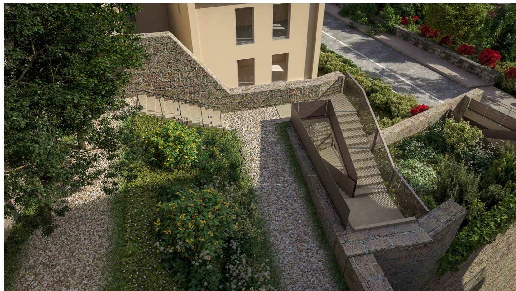
5. PARCO PERCORSO: CAMMINAMENTI E SCALE