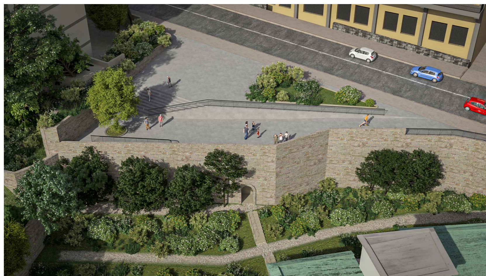
3. PIAZZA DI QUARTIERE E PARCO PERCORSO