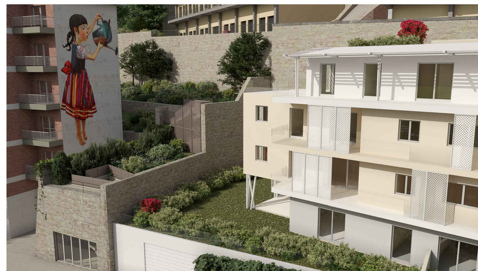
4. PARCO PERCORSO: ACCESSO E SCALE