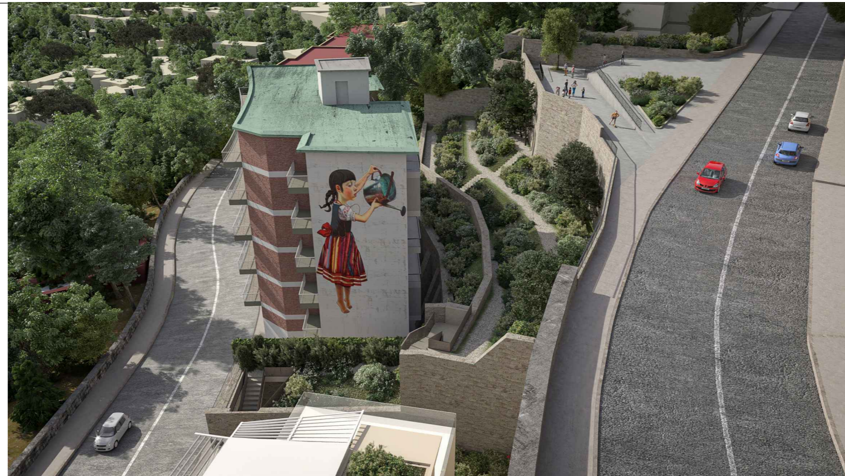
1. PIAZZA DI QUARTIERE E PARCO PERCORSO

IL PROPONENTE "B & B IMMOBILIARE S.R.L."