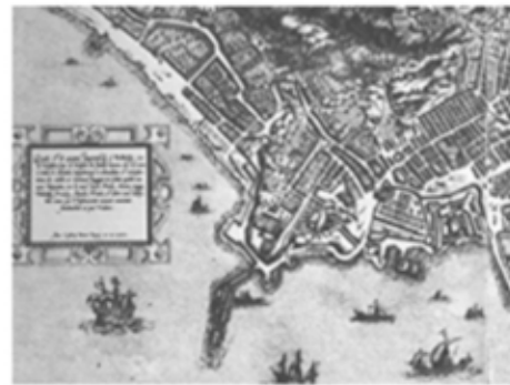
Veduta di Napoli - Lafrery 1566