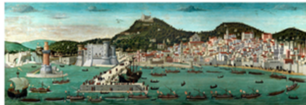
Veduta di Napoli - Tavola Strozzi 1472