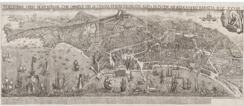
Veduta di Napoli - Baratta 1628