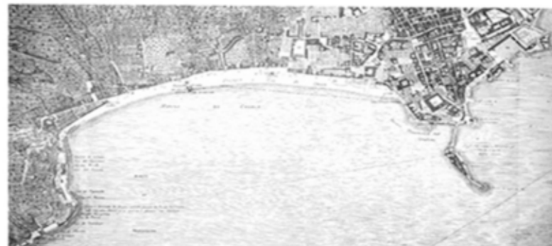
Veduta di Napoli - Duca di Noja 1775