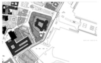
Strafcio Variante al PRG - Tavola 7 foglio 14 II