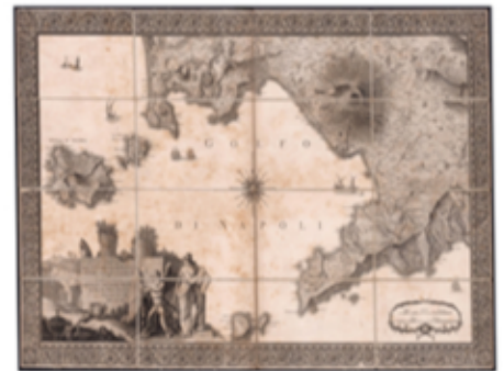
Veduta di Napoli - Rizzi Zannoni 1794