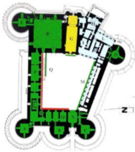
Schema planimetrico di Castel Nuovo