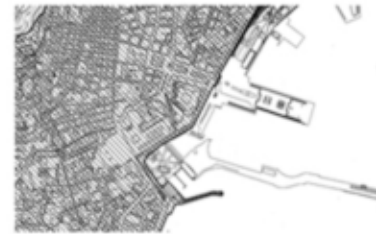
Strafcio Variante al PRG TAV 14 Foglio 3 Vincoli e aree di interesse archeologico