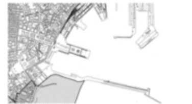
Strafcio Variante al PRG TAV 13 Foglio 3 Vincoli paesaggistici ex L. 1497/39 e 431/85