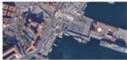
Castel Nuovo - Vista dal satellite