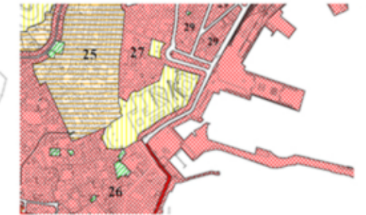
Strafcio di Piano di Zonizzazione Acustica L. 447/95 Foglio 3 Zona II