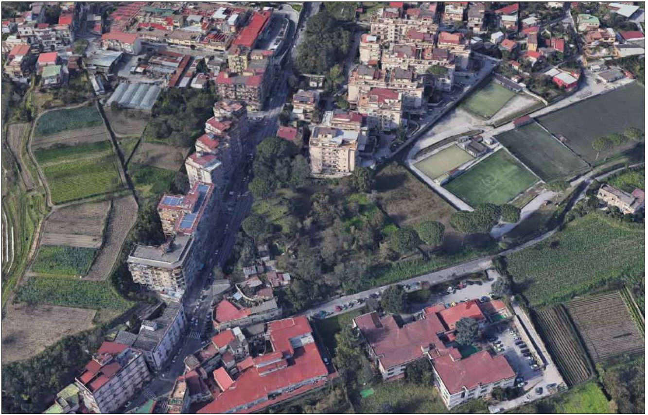
VISTA NORD EST