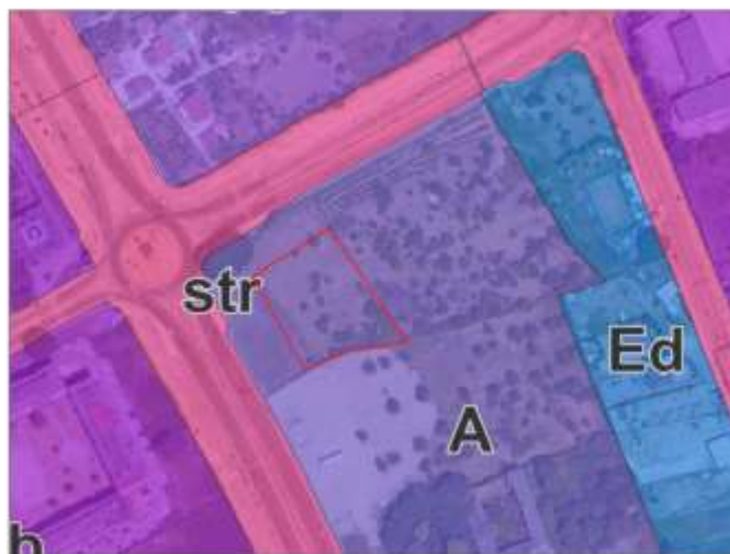
P.R.G. _scala 1/2000