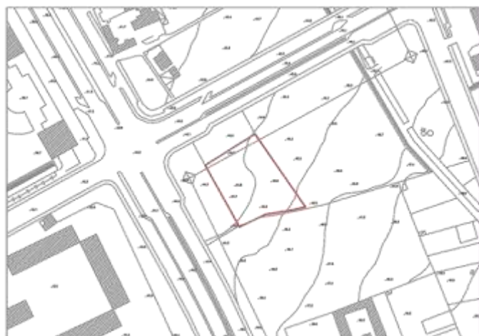
Stralcio aerofotogrammetrico _scala 1/2000