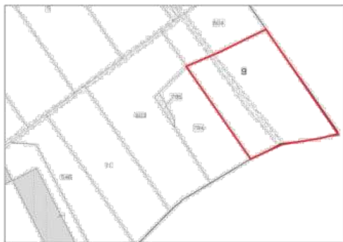
Catastale _scala 1/1000