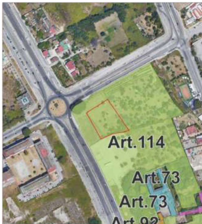
Ortofoto _scala 1/2000