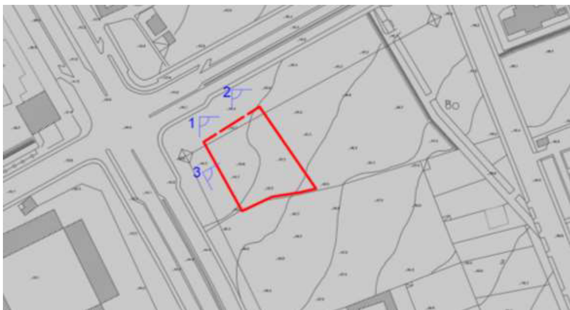
Planimetria con coni ottici