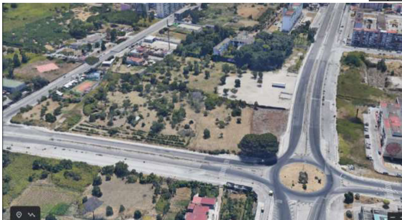
Vista Tridimensionale