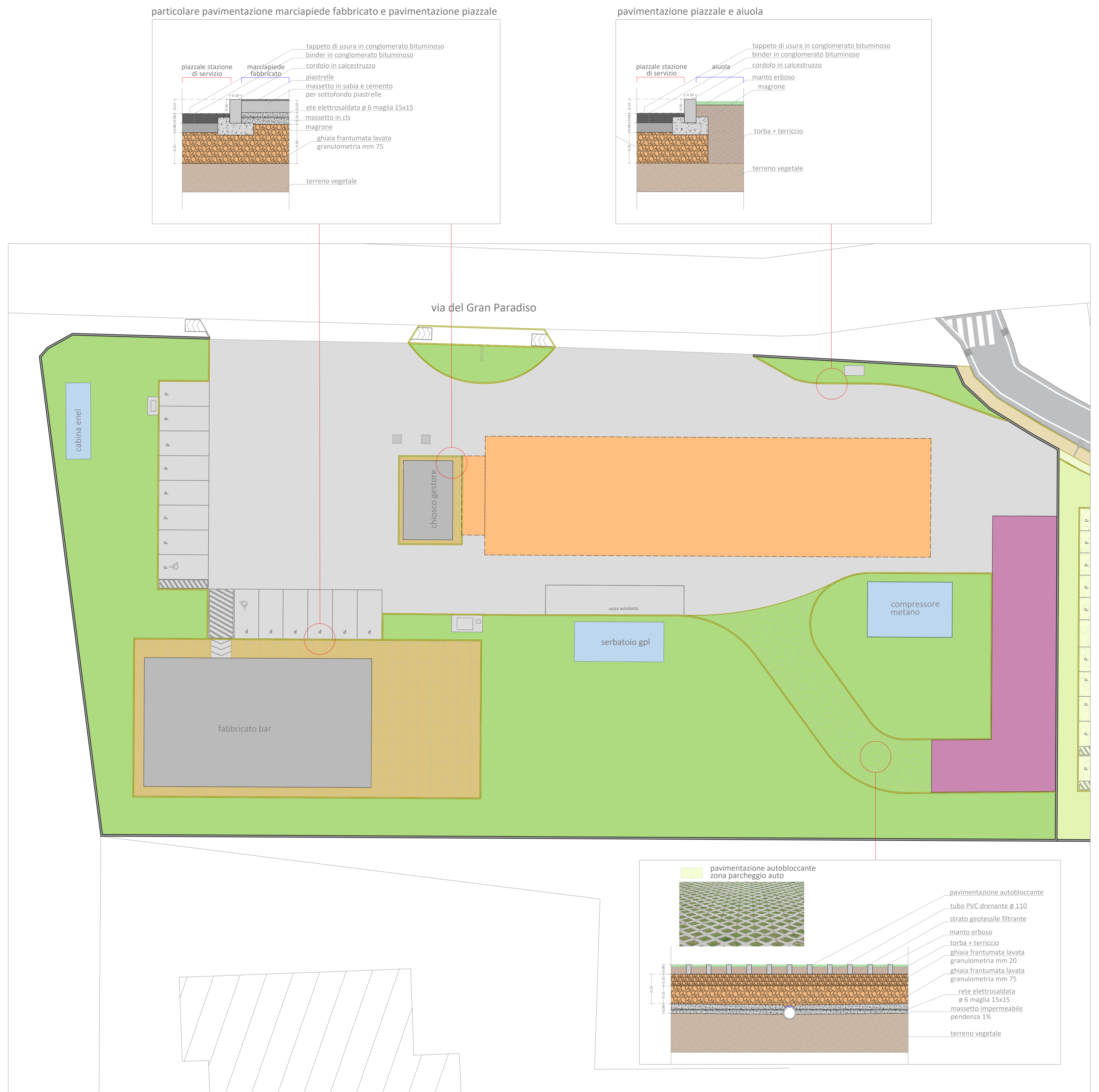
particolare pavimentazione marciapiede fabbricato e pavimentazione piazzale