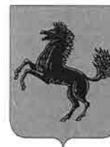
Città Metropolitana di Napoli