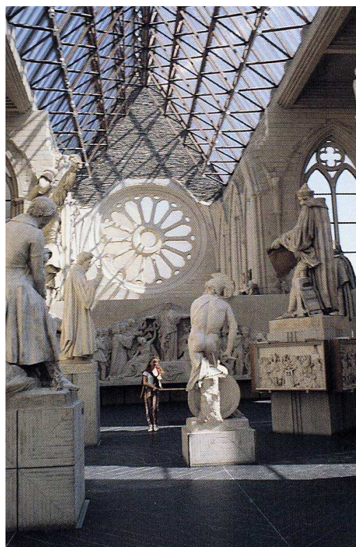
Esempio evocativo : P .Prunet - Museo David di Angers.