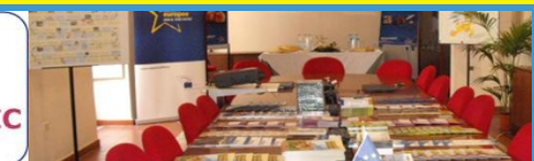
INIZIATIVE DEL PST EUROPE DIRECT SALERNO E AIC