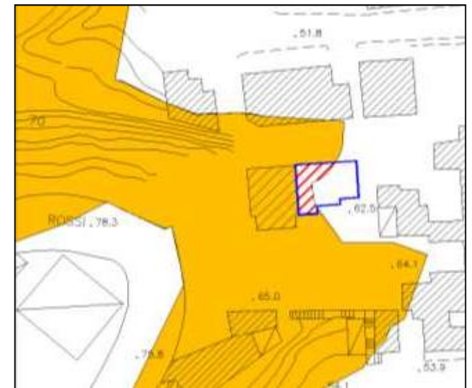
CARTA PROPOSTA DELLA PERICOLOSITA' RESIDUA