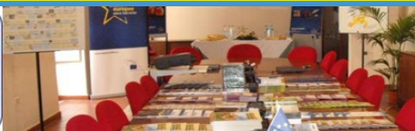
INIZIATIVE DEL PST EUROPE DIRECT SALERNO E AIC