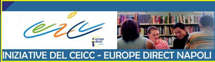
INIZIATIVE DEL CEICC - EUROPE DIRECT NAPOLI