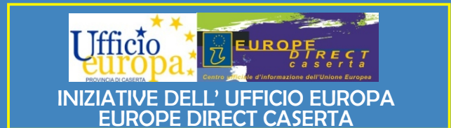
INIZIATIVE DELL'UFFICIO EUROPA EUROPE DIRECT CASERTA

Co-finanziato dalla Commissione europea - Programma "Gioventù in Azione", Azione 1.3 Giovani e Democrazia - il concorso è rivolto ai giovani dai 15 ai 17 anni residenti in provincia di