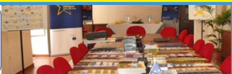
INIZIATIVE DEL PST EUROPE DIRECT SALERNO E AIC