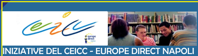
INIZIATIVE DEL CEICC - EUROPE DIRECT NAPOLI