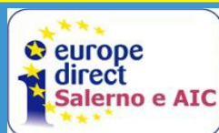
INIZIATIVE DEL PST EUROPE DIRECT SALERNO E AIC

Contatti - mail: europedirect@provincia.caserta.it Web: www.ufficioeuropacaserta.it Facebook: Ufficio Europa Caserta