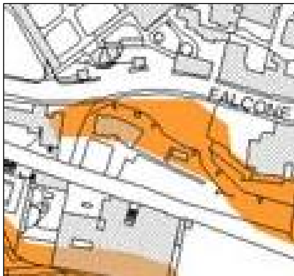
CARTA DEL RISCHIO DA FRANA